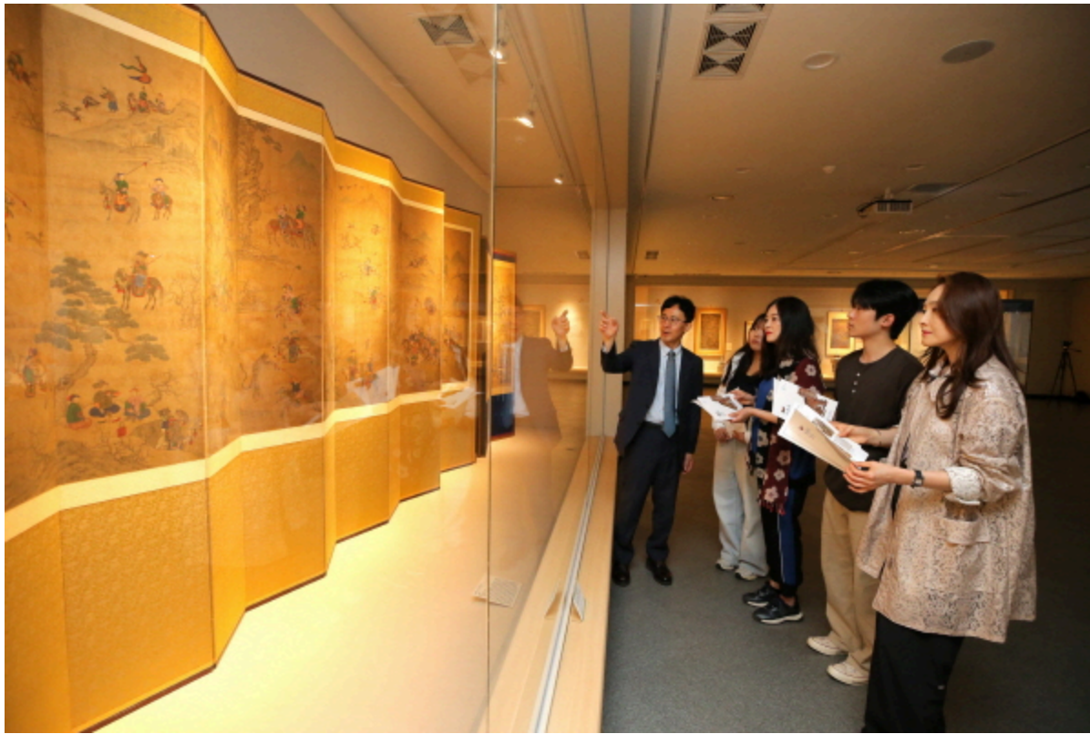
해설사가 관람객에게 사냥하는 그림 속 호랑이에 대해 설명하고 있다.(사진=계명대)

창립 126주년 맞아 5월22일부터 10월31일까지 무료 관람 90여 점의 회화, 도자기, 공예품과, 미디어 아트 영상으로 동물과 인간의 관계 조명