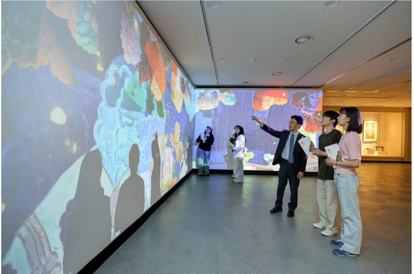
▲ 계명대학교(총장 신일희)가 창립 126주년을 맞아 5월 22일부터 10월 31일까지 행소박물관에서 특별전 '동물과 인간'을 개최한다.

기사입력 2025-05-23 21:34:50 | 최종수정 2025-05-23 21:35:13 | 강승탁 기자 | stking12@newdailybiz.co.kr