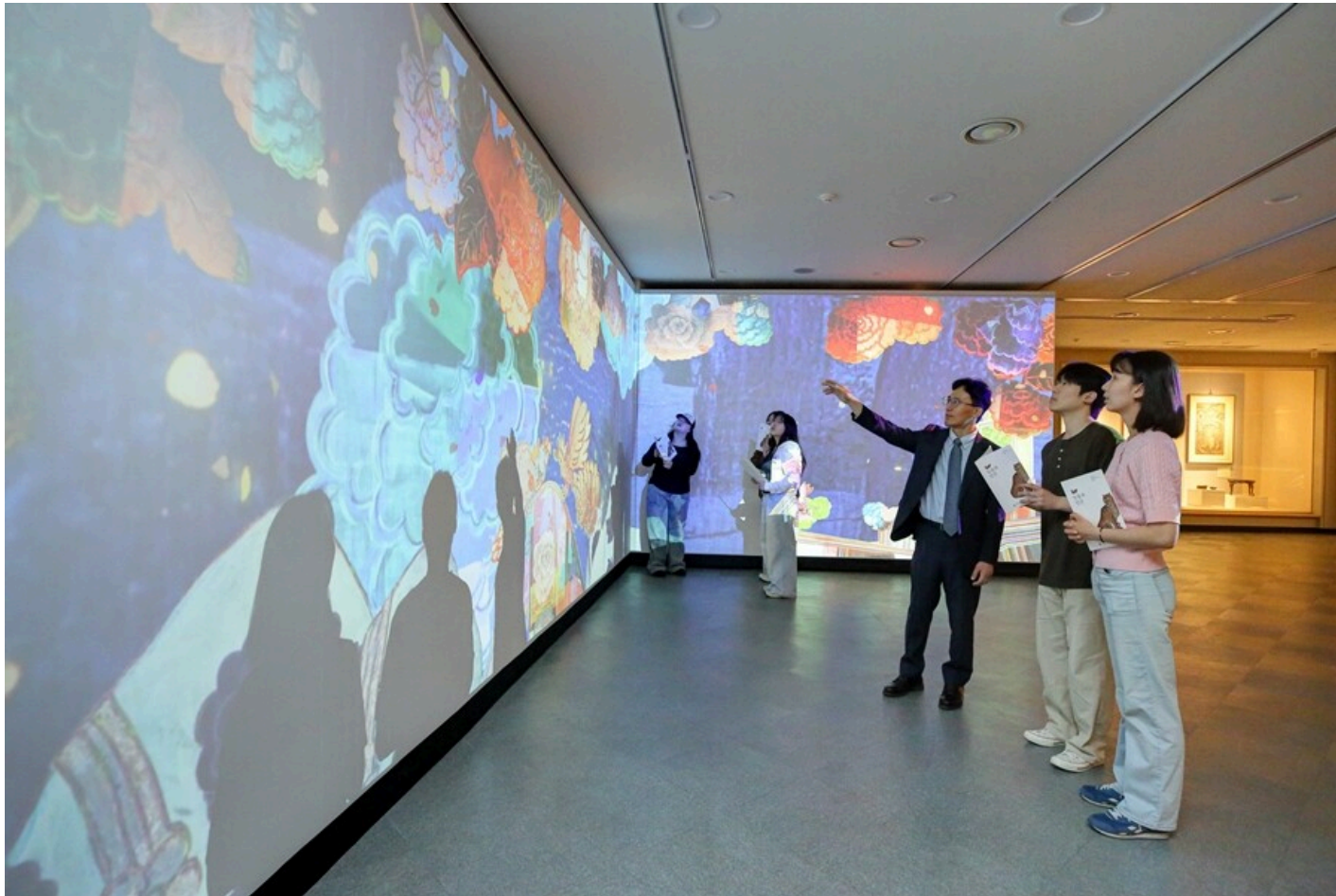
해설사가 그림,영상,음향의 융합으로 탄생한 '판타지아 무릉도원'에 대해 설명하고 있다.

[대학저널 온종림 기자] 계명대학교가 창립 126주년을 맞아 22일부터 10월 31일까지 행소박물관에서 특별전 "동물과 인간"을 개최한다. 이번 전시는 동물과 인간의 오랜 관계를 예술 작품을 통해 돌아보며, 동물이 지닌 상징성과 의미를 다각적으로 조명한다. 전시는 박물관 1층 동곡실(특별전시실)에서 열린다.