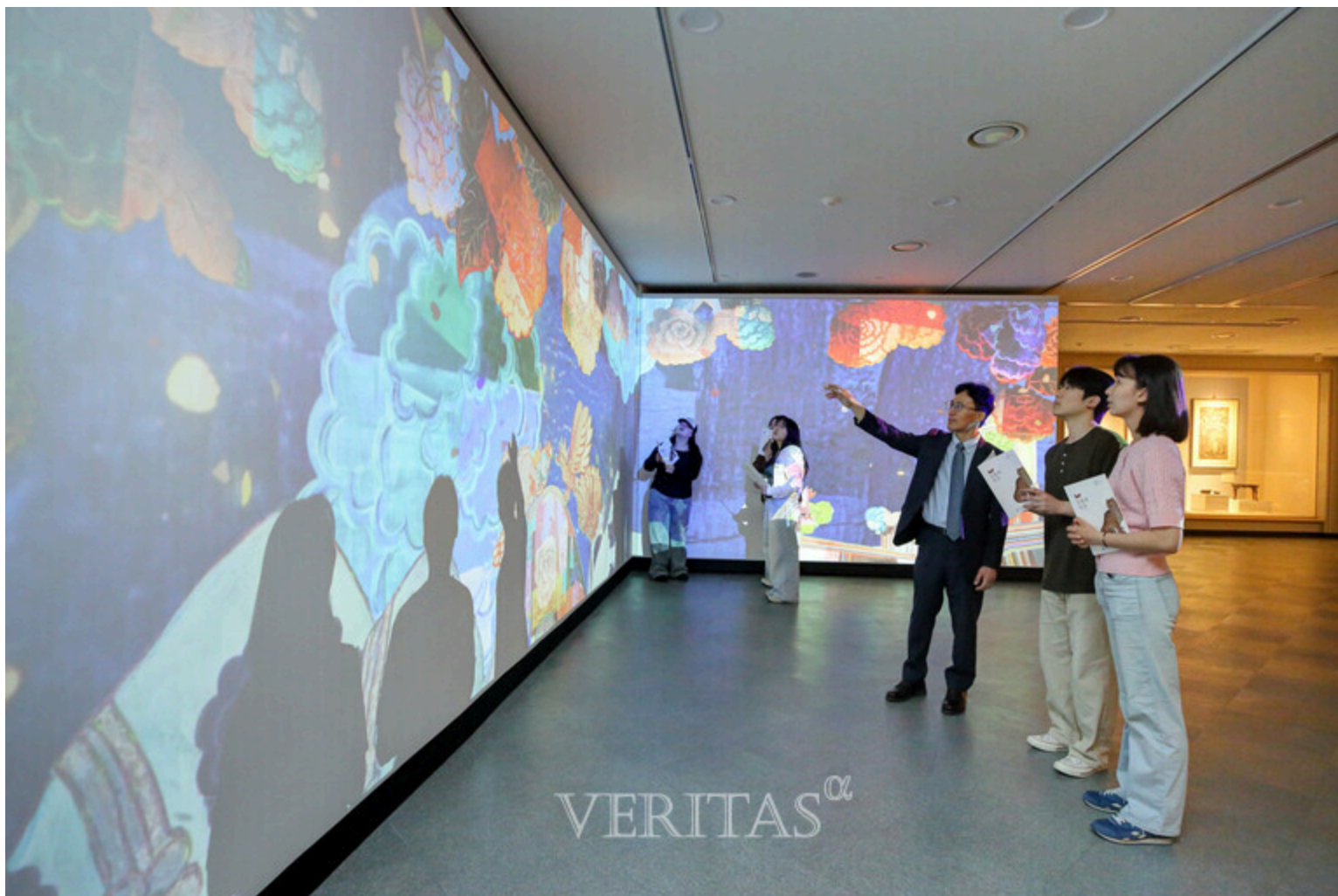
계명대는 창립 126주년을 맞아 5월22일부터 10월31일까지 행소박물관에서 특별전 '동물과 인간'을 개최한다.

전시 기간에는 '머그컵에 동물 문양 그리기' 체험 프로그램도 함께 운영된다. 관람 시간은 월요일부터 토요일, 오전 10시부터 오후 5시까지이며, 공휴일에도 개방된다. 관람료는 무료다. 자세한 사항은 계명대 행소박물관 학예연구팀으로 문의하면 된다.