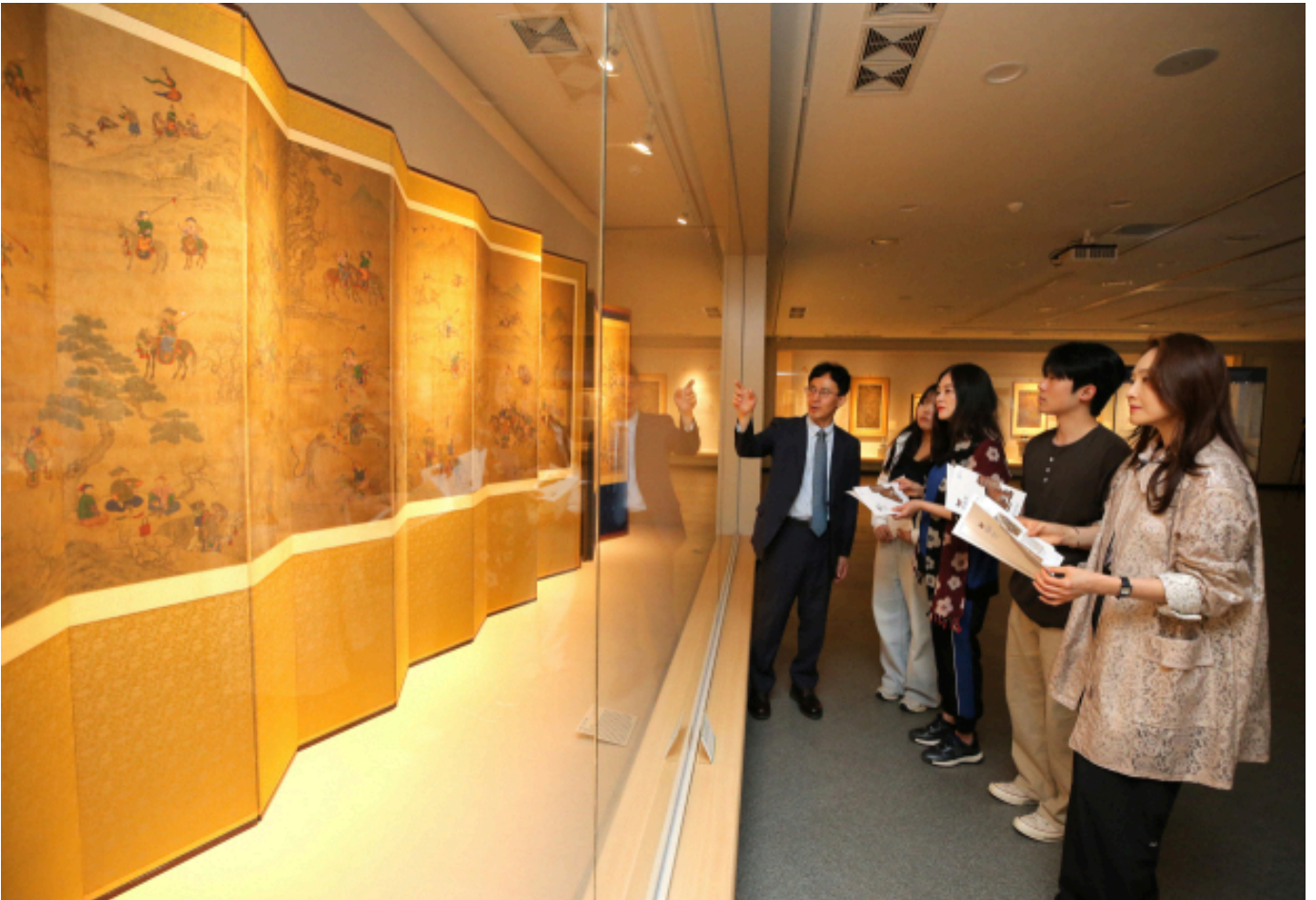
계명대 행소박물관 해설사가 관람객에게 사냥하는 그림 속 호랑이에 대해 설명하고 있다.

계명대가 창립 126주년을 맞아 인간과 동물의 관계를 예술로 풀어낸 특별 전시를 선보인다. 시대를 넘나드는 예술을 통해 동물과 인간 사이 오래된 대화를 들여다보는 기회가 될 전망이다.