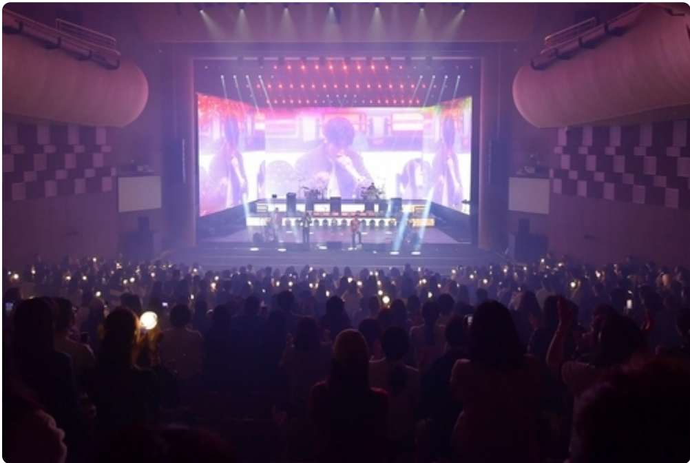
경주예술의전당 공연 모습.