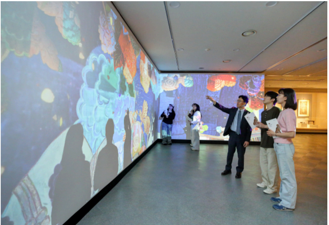
계명대 행소박물관 해설사가 그림과 영상, 음악의 융합으로 탄생한 '판타지아 무릉도원'에 대해 설명하고 있다.

특별전 '동물과 인간' 개최, 5월부터 10월까지 90여 점 작품으로 풀어낸 인간과 동물의 관계 용맹·지혜·권위...다섯 가지 상징으로 동물의 의미 조명