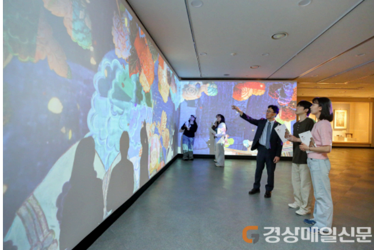
계명대가 창립 126주년을 맞아 오는 10월31일까지 행소박물관에서 특별전 '동물과 인간'을 개최한다.

이태헌 기자 leeth9048@ksmnews.co.kr 입력 | 수정 2025.05.25 19:43