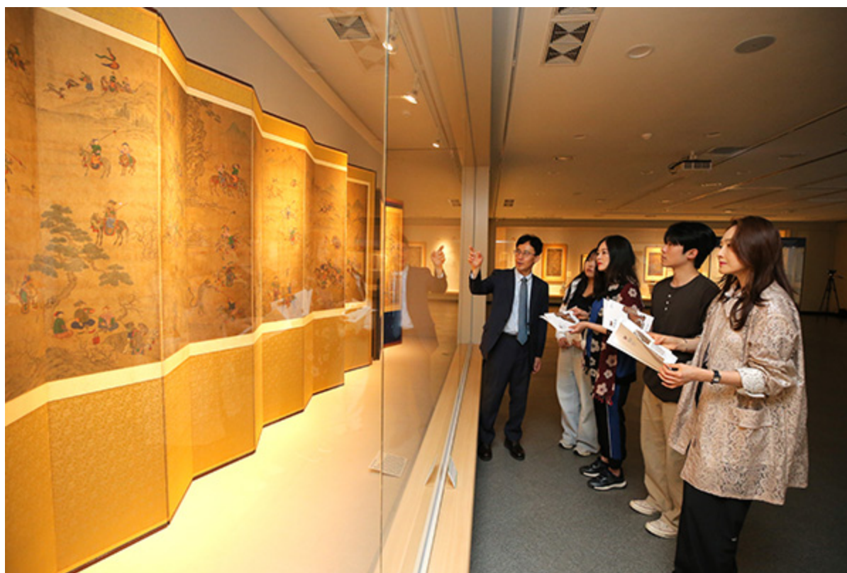
해설사가 관람객에게 사냥하는 그림 속 호랑이에 대해 설명하고 있다.

90여 점의 회화, 도자기, 공예품과, 미디어 아트 영상으로 동물과 인간의 관계 조명