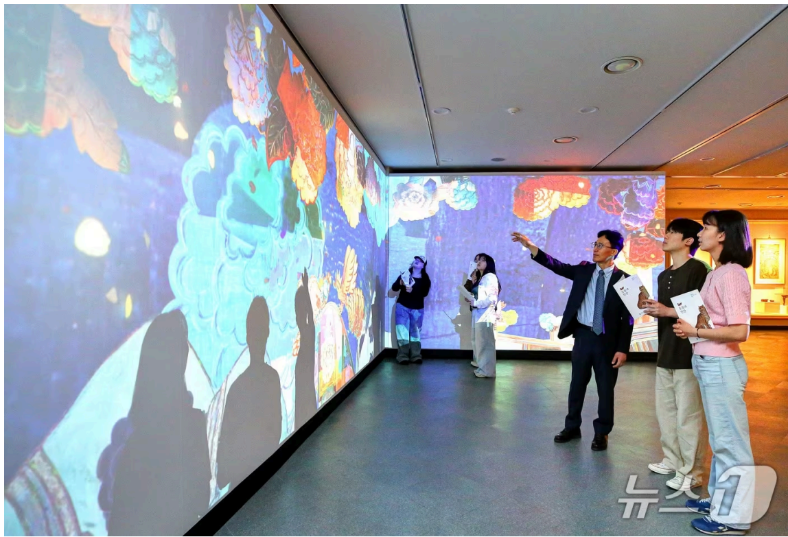
계명대 행소박물관에서 열린 창립 126주년 특별전 '동물과 인간'을 찾은 관람객이 해설사로부터 그림·영상·음향의 융합으로 탄생한 '판타지아 무릉도원'에 대한 설명을 듣고 있다. (계명대 제공·재판매 및 DB금지)

(대구=뉴스1) 공정식 기자 = 계명대는 창립 126주년을 맞아 교내 행소박물관에서 '동물과 인간' 특별전을 오는 10월까지 개최한다.